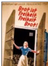
PLAKAT ZUM INTERNATIONALEN FRAUENTAG 1947

1953 fand in Innsbruck eine Abschlusskundgebung mit 15.000 Frauen statt, zu der Teilnehmerinnen aus ganz Österreich, Deutschland und der Schweiz anreisten.