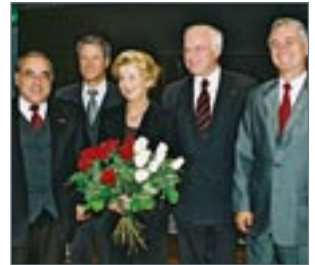
30.10.2002 - WAHL DER BÜRGERMEISTERIN

Am 30. Oktober 2002 wurde Hilde Zach von der Fraktion Für Innsbruck (die 1994 von Herwig van Staa und von Hilde Zach gegründet wurde) zur ersten Bürgermeisterin einer Landeshauptstadt gewählt und angelobt.